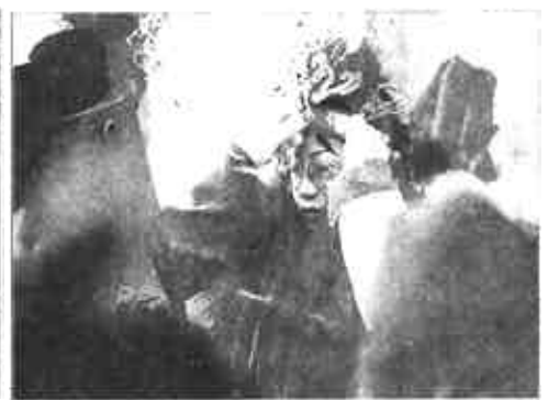
红妆扮闹新春。