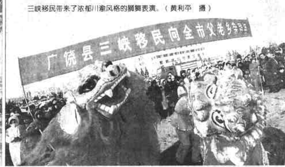
三峡移民带来了浓郁川渝风格的狮舞表演。