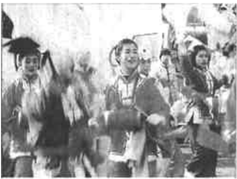
垦利代表队青春似火的少女腰鼓表演。