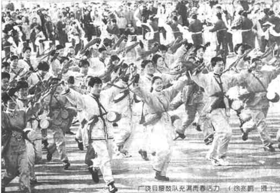
广饶县腰鼓队充满青春活力。