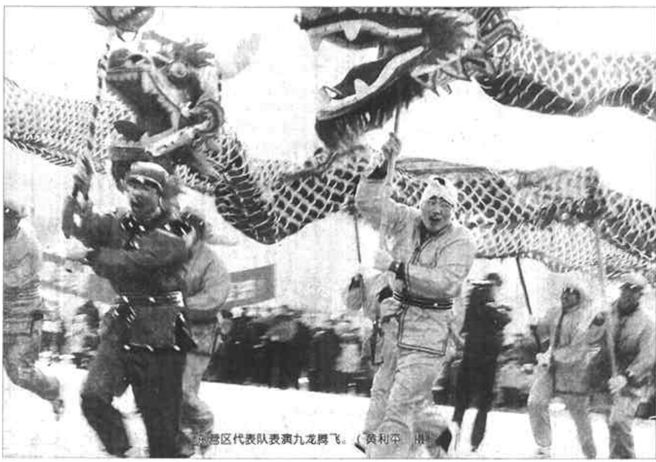
东营区代表队表演九龙腾飞。

吕雪萍说，今年是跨入新世纪的第一年，是全面实施“十五”计划的起步年，是中国共产党成立80周年，也是我市实施大开放、大招商加快经济社会发展的重要一年。我们要以纪念建党80周年为契机，精心组织好各项宣传教育和文化活动，广泛开展形式多样、生动活泼的爱党、爱国、爱社会主义