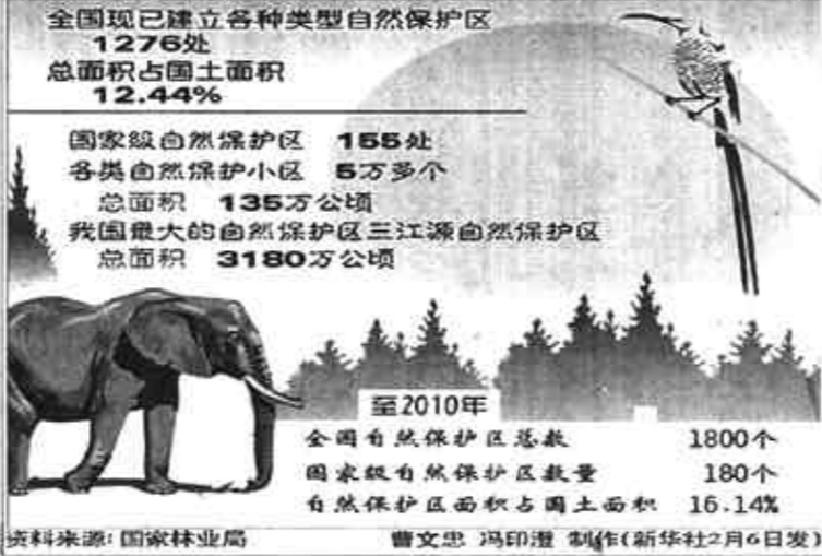
资料来源:国家林业局 曹文忠 冯印澄 制作(新华社2月6日发)