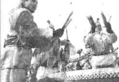
响鼓加重槌，新世纪就该是这样的鼓点。