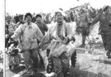
河口区代表队的表演幽默风趣。